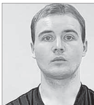
Das Phantombild des mutmaßlichen Täters.

Mehr als 100 Beamte sind in der Bodenseeregion im Einsatz. Kräfte der Polizeireviere Überlingen und Friedrichshafen hatten mit Unterstützung der Bereitschaftspolizei seit Freitag mehr als 800 Betriebe mit Saisonarbeitskräften aufgesucht und dort das Flugblatt mit Phantombild – das inzwischen auch in osteuropäische Sprachen übersetzt wurde – verteilt. „Wir gehen den Fragen nach, wer kennt den Täter und wer weiß, wo er sich aufhält?“, erläutert Markus Sauter, Pressesprecher der Polizeidirektion Friedrichshafen gegenüber der Schwäbischen Zeitung. Um kurz vor 16 Uhr präsentiert die Polizei ihren